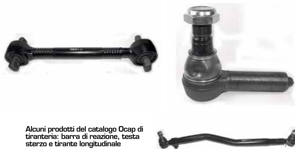
Alcuni prodotti del catalogo Ocap di tiranteria: barra di reazione, testa sterzo e tirante longitudinale

Nel primo impianto il core business di Ocap per truck e autobus è la progettazione e pro-