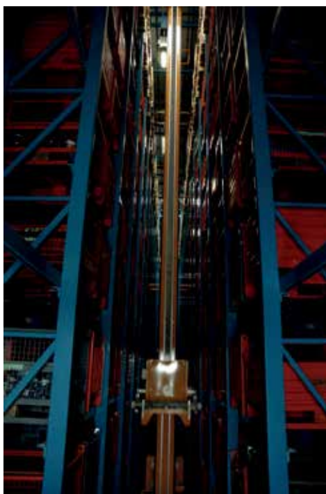
Il magazzino robotizzato di Oglianico di Ocap

"Nel settore del primo equipaggiamento, Ocap fornisce i più prestigiosi costruttori di macchine sportive e occupa una posizione di assoluto rilievo nella fornitura di componentistica per il mercato del veicolo industriale, delle macchine agricole e movimento terra. Nell'aftermarket la tiranteria truck in passato era stata gestita solo in modo parziale da Ocap International con un numero limitato di codici. Da marzo-aprile 2020 ci siamo concentrati su questo progetto, che si è concretizzato nel dicembre scorso. Ora siamo in grado di offrire una gamma costantemente aggiornata. Abbiamo obiettivi ambiziosi e intendiamo proporci sul mercato come azienda italiana di riferimento anche per il settore truck".